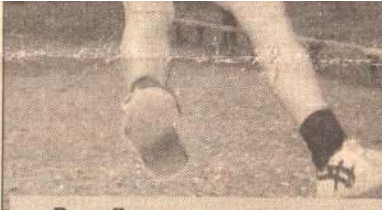
Во «Взлете» все хотят быть сильными и ловкими.