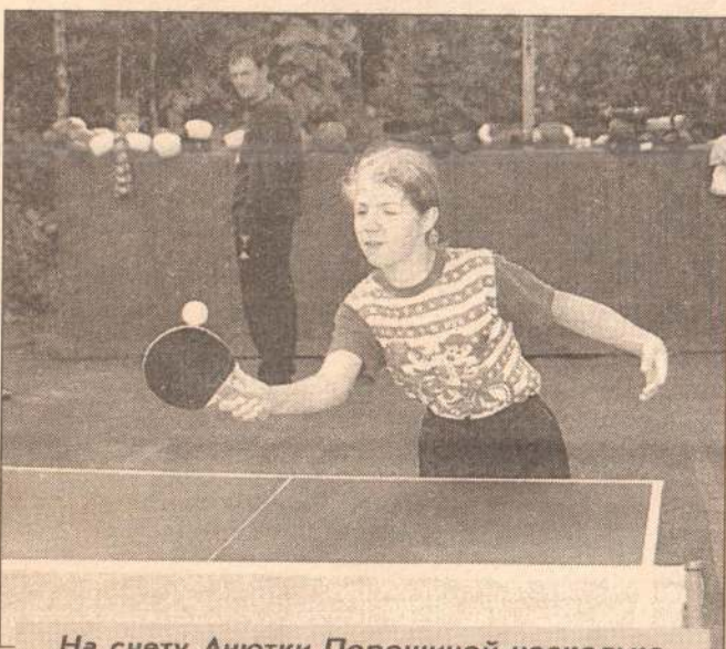
На счету Анютки Порошиной несколько серьезных побед.

Наталья АЛТУНИНА.