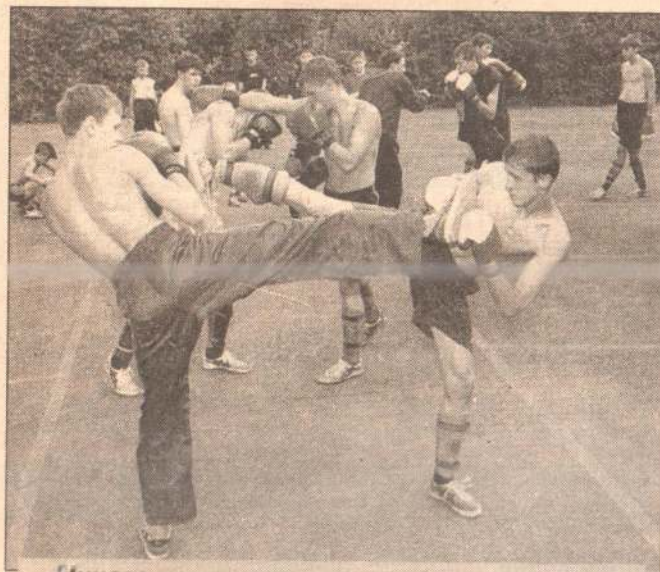
Ничего удивительного — здесь отдыхают кикбоксеры.