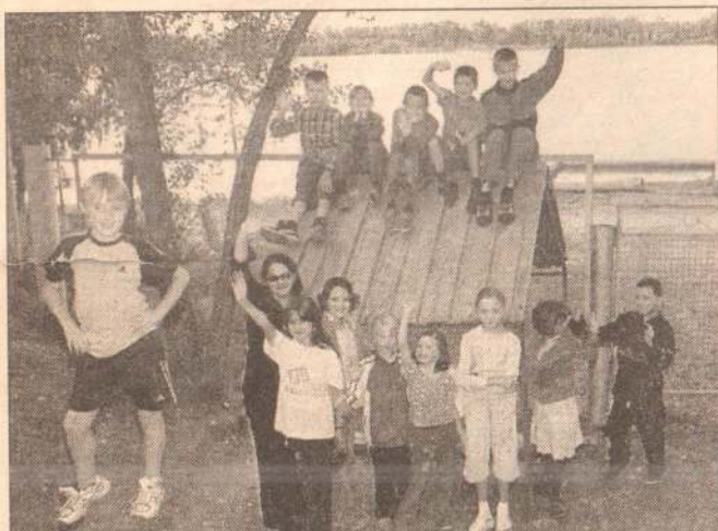
Мам-пап, привезите больше конфет. Нас тут много!