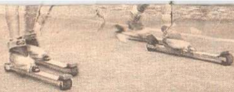
Наша специализация - лыжные гонки.

специализация: пловец ты или, скажем, легкоатлет, занимаешься кикбоксингом или лыжными гонками. И ничего удивительного в том нет, ведь здесь отдыхают спортсмены.